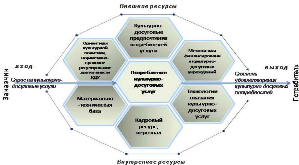
Рис. 2 Модель функционирования культурно-досуговых учреждений

Представим типовую модель функционирования КДУ в виде схемы (рис. 2)