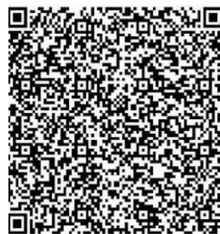
QR для ОСТАЛЬНЫХ БАНКОВ

Обязательно указывайте в сумме платежа «в том числе НДС» .