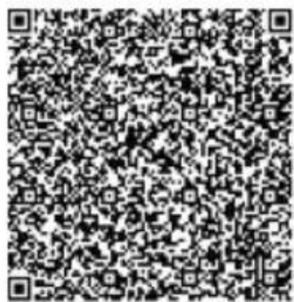
QR для СБЕРБАНКА

Министерство финансов Мурманской области (ГОВАУК "Мурманский областной Дворец культуры и народного творчества им. С.М. Кирова", л/с 902Ц8631000)